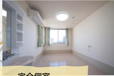
完全個室 洗面・エアコン・照明・カーテン付