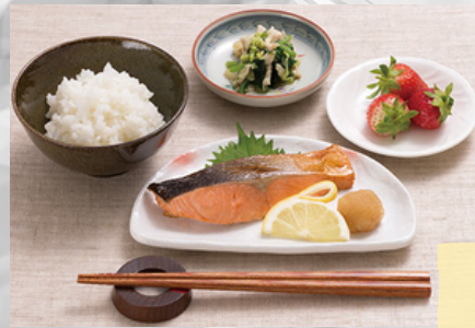
食事の提供 朝・昼・夕