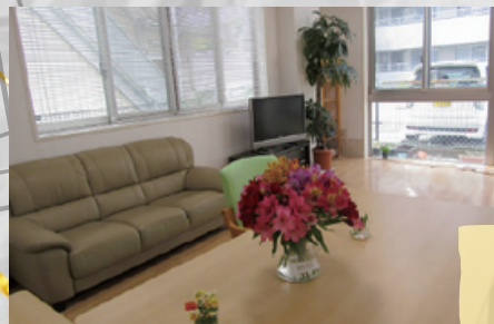
落ち着きのある空間

全室個室になっています。また室内はバリアフリーの設計となっており、安心安全な居住環境です。